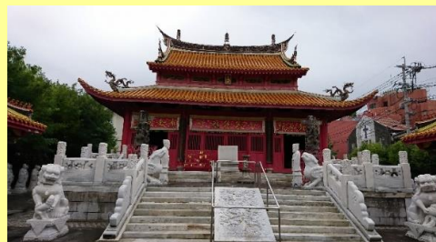
長崎／孔子廟（中国歴代博物館）