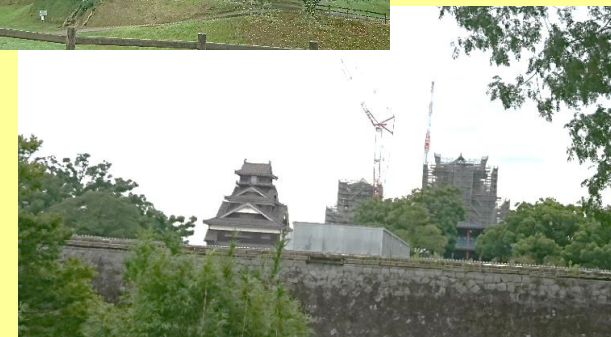
熊本城／元の姿に戻れますように応援します。