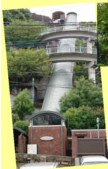
長崎／スカイロード